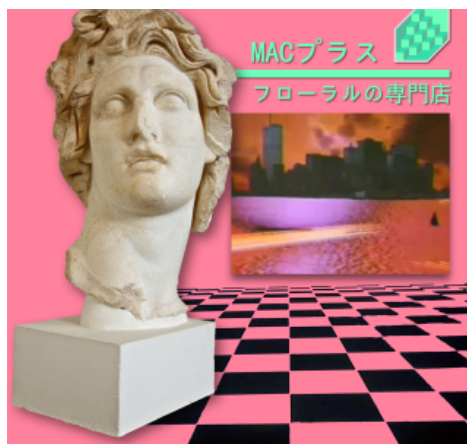
Obr. 3: obal alba Floral Shoppe z roku 2011, které se stalo učebnicovým příkladem žánru Vaporwave XAVIER, R. A. Floral Shoppe [obal alba], 2011.