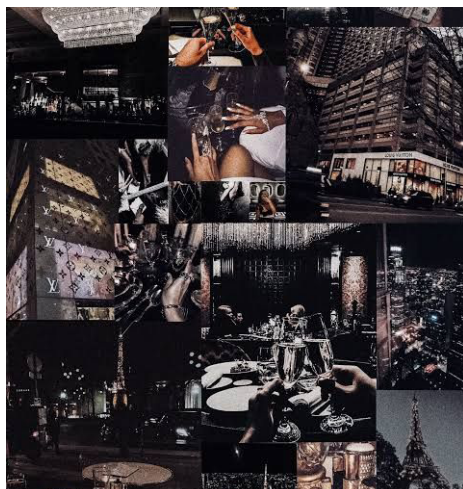
Obr. 2: ilustrační koláž mikrotrendu a takřečené estetiky Night Luxe z pinterestového moodboardu

In: aesthetics.fandom.com [online]. 24. dubna 2022 [cit. 2024-07-05]. (upravený poměr stran) Dostupné z: https://aesthetics.fandom.com/wiki/File:That_girl_.jpg