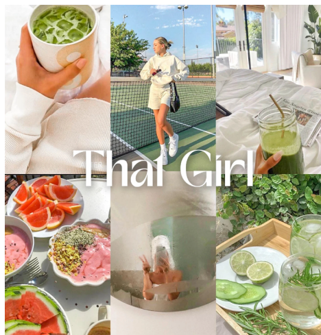
Obr. 1: ilustrační koláž mikrotrendu a takřečené estetiky That Girl použitá na stránce Aesthetics Wiki

In: aesthetics.fandom.com [online]. 24. dubna 2022 [cit. 2024-07-05]. (upravený poměr stran) Dostupné z: https://aesthetics.fandom.com/wiki/File:That_girl_.jpg